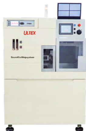
SCS Lab system