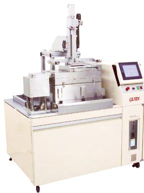
CSS Lab system