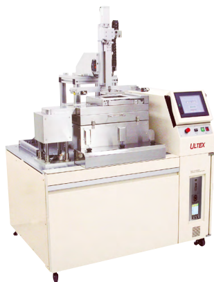
CSS Lab system