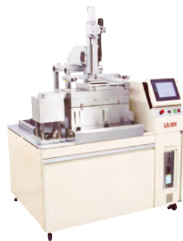
Sound Cavity Soldering System/CSS